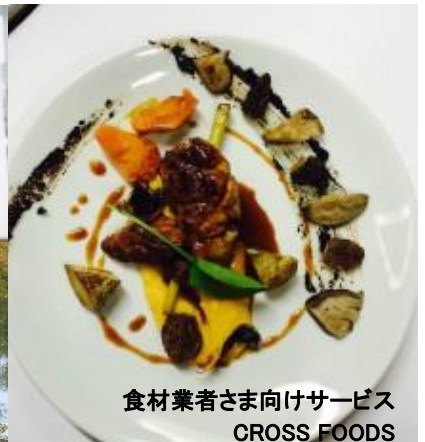
食材業者さま向けサービス CROSS FOODS